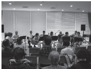
2016年「スプリングコンサート演奏風景」

2009 年 5 月にスタートした講座のひとつ【ギターで歌おう!楽しいフォークギター講座】講座開始をきっかけに結成されました。全く弾けなかった人が、爪弾きながら歌えるようになり、また学生時代からずっと演奏していた人や、久しぶりの人もいて、腕前にいづらか差がありますが、グループを組んだりしてアンサンブルを楽しんでいます。それから 7 年ばかり経過し、今では腕もすこしあがってきて、年恒例の戸塚倉田コミュニティハウス文化祭の音楽会への参加や内輪関係者を招いての発表会等活発な活動を行っています。