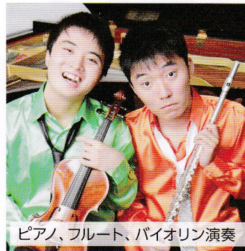
ピアノ、フルート、バイオリン演奏