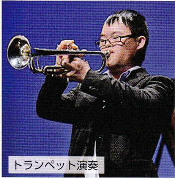
トランペット演奏