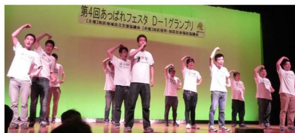
ダンスパフォーマンス： はっばオールスターズ