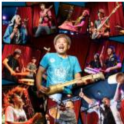
AJATE(お囃子アフロビートバンド)