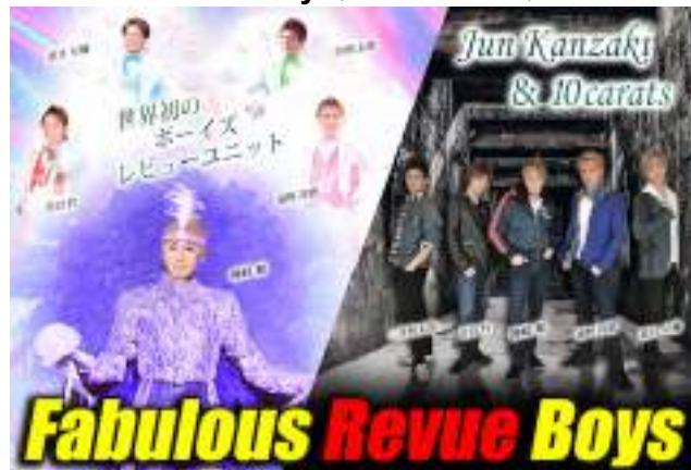
Fabulous Revue Boys(レビューショー)