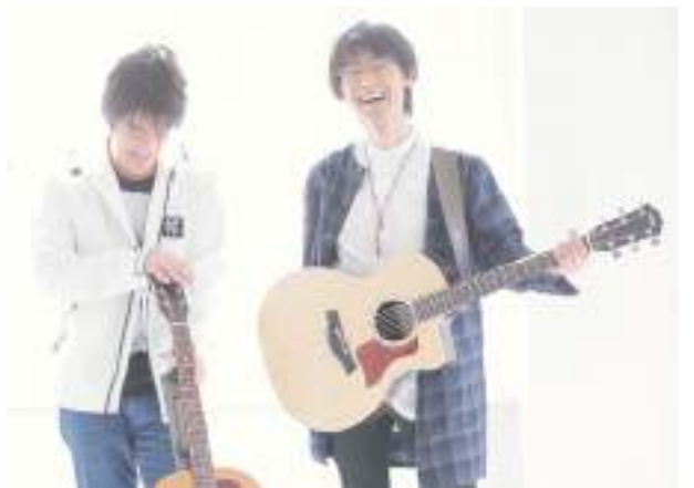
N.U.(アコースティックデュオ)