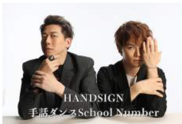
HANDSIGN 手話ダンスSchool Number (手話ダンス)