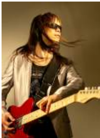
田川ヒロアキ(ポップロック)