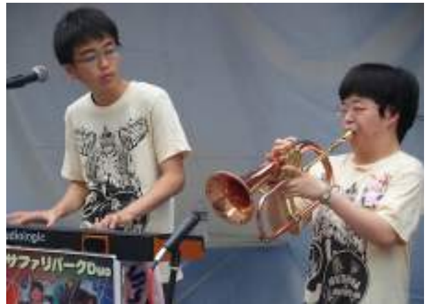
サファリパークDuo (ジャズ)