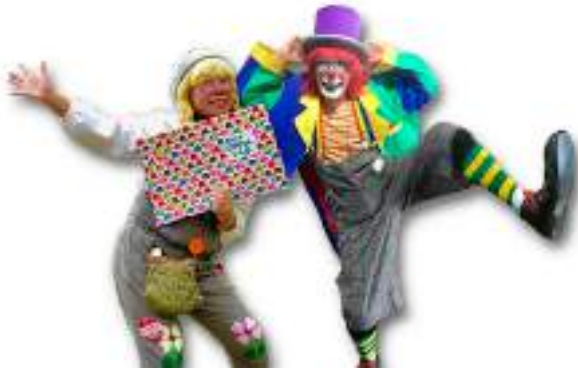
ぴんちゃん&まこっちゃん(クラウンショー)