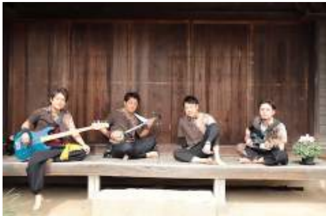
蛇三線ロックバンド ティダ(蛇三線ロック)