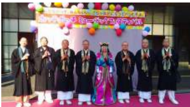
真言聲明(宗教音楽)